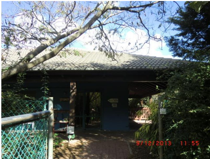
תמונה 3 : ספריית הגן – קיר גב לוח החשמל